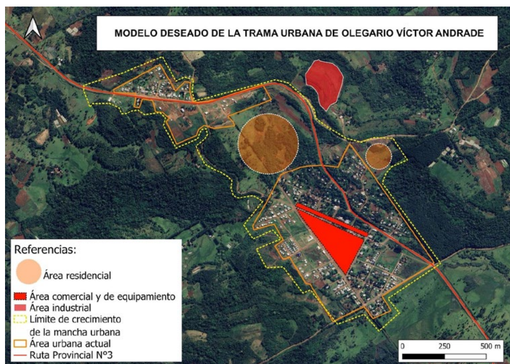
Figura 3 Modelo de Zonificación deseado para la localidad de Olegario Víctor Andrade