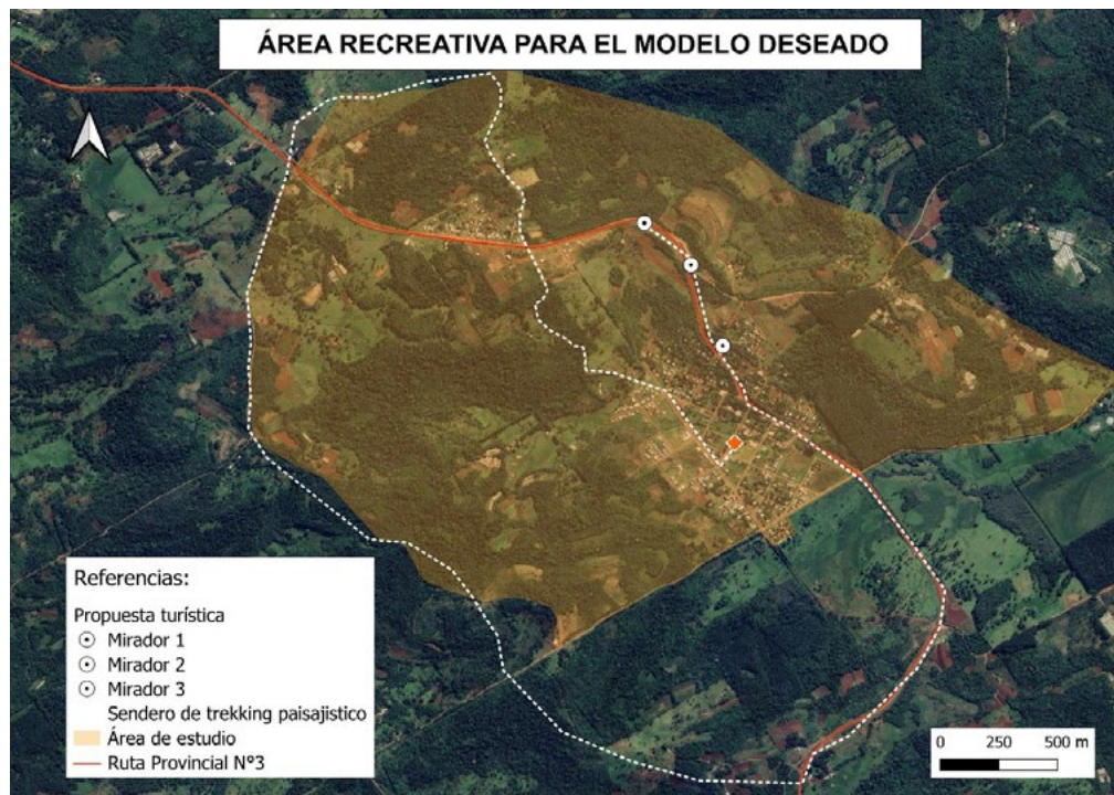
Figura 4 Modelo deseado para uso de suelo recreativo de la localidad de Olegario Víctor Andrade